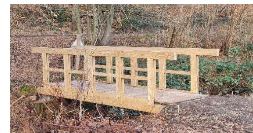
Neue Bachbrücke am Karl-May-Weg im Ruhbachtal